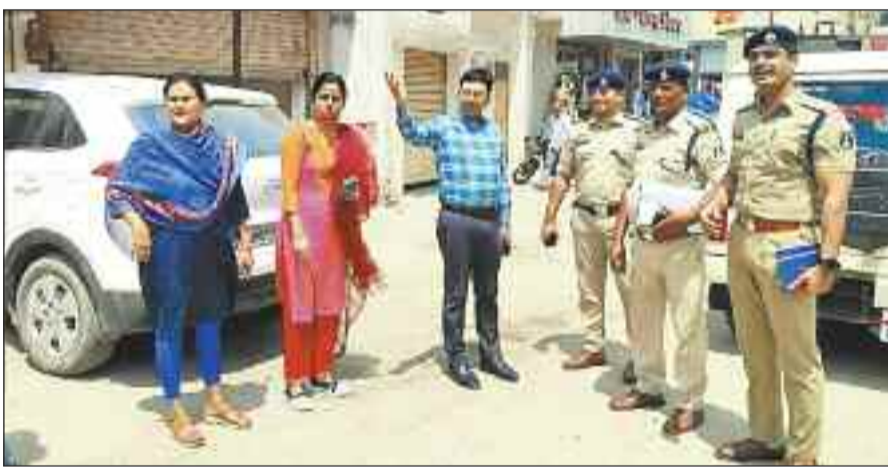
स्थल निरीक्षण करते एसपी व अन्य अधिकारी।

पुलिस अधीक्षक ने अधिकारियों को चार दिनों के भीतर कार्ययोजना तैयार करने के निर्देश दिए हैं। स्थल निरीक्षण के दौरान यातायात व्यवस्था में बाधा