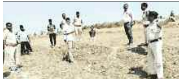
घटना स्थल का निरीक्षण करते वन अधिकारी।