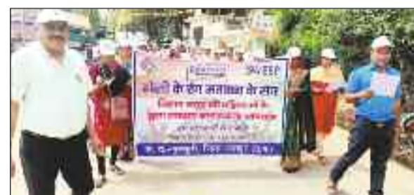
रैली में शामिल बिहान स्व सहायता समूह की महिलाएं।

जशापुरनगर। जिले में स्वीप कार्यक्रम के तहत लोकसभा चुनाव में शत-प्रतिशत मतदान के प्रति लोगों को जागरूक करने